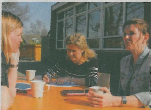
Leraren buiten op speelplaats.

Dat de school Abraham ziet wil niet zeggen dat de school "op leeftijd" is. Dat blijkt zeker uit het feit dat de school, die onder de paraplu van de Lowys Porquin