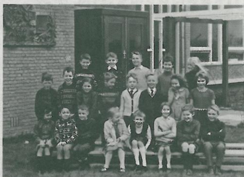
Oude klassenfoto 1967/1968.